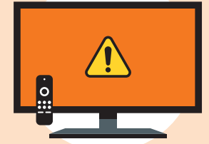
شاشات المعلومات الرقمية