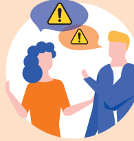
دائرة العائلة والأصدقاء، الجيران