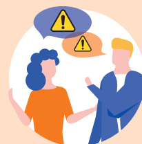
familia, amigos, vecinos